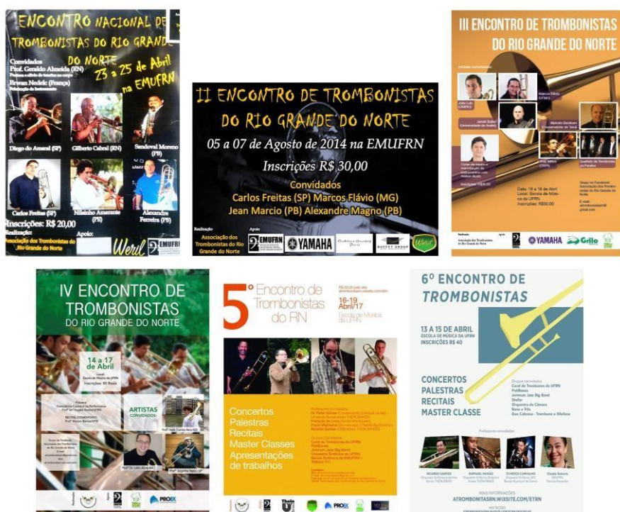
Figura 1: Cartazes de todas as edições dos encontros

Em todos os anos do evento houve a formação do coral de trombones do encontro realizando apresentação musical no encerramento possibilitando aos participantes um momento de prática em conjunto e interação.